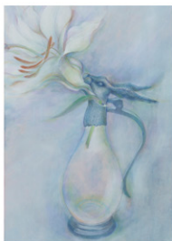
杜 今日子 「舞ふ」 53.0×33.3cm 2012年

武蔵野美術大学日本画学科で学んだ作家5人です。 おもに関東で活動していますが、名古屋では初めての展覧会となります。 制作を通じてそれぞれの抱く「古今(cocon)」をタイトルに選びました。 ぜひご覧願いたくご案内申し上げます。