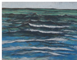
近藤 銅一郎 「大風の歌」 24.0×31.5cm 2016年

AOI CLUB/Cafe/Gallery/Studio 〒461-0004 名古屋市東区築1-18-5 葵倶楽部 GALLERY TEL/FAX 052-934-7035