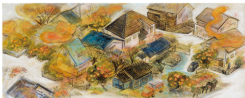
池田 美弥子 「Winter Orange」17.8×44.0cm 2017年