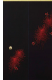
神谷 由美 「女の子 no.4 ONNNA NO KO」 装幀作品 176×68.5cm 2017年