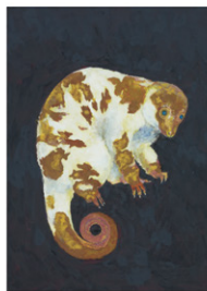
稲垣 晴子 「クスクスI」 33.4×24.3cm 2012年